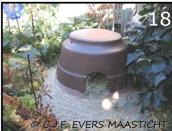
Afb.18 Nieuw egelhuis van Schwegler geplaatst. Gevuld met hooi van een Alpenweide. Dit ruikt heerlijk kruidig. Nu nog een "snurker".

Er was niet duidelijk of die ooit zelfgebouwde egelkast onder de houtwal nou wel geschikt was. Omdat het toch een komische gedachte is nog een "onderhuurder" in de tuin te hebben is een egelkast van Schwegler in de tuin gezet. Sindsdien heeft er een keer een egel de winter in doorgebracht en een keer een egel tot november in geslapen. Voor de winterslaap heeft deze egel toch een andere plek gekozen. Deze egelkast van Schwegler is van houtbeton gemaakt. De onderplaat waar de "deksel" op rust is van grover houtbeton gemaakt en omdat dit gedeelte op de grond ligt wordt het nat en rot het erg vlug. Daarom heb ik de egelkast met drie stukjes pvc afvoerbuïs circa acht cm. boven de grond gezet.