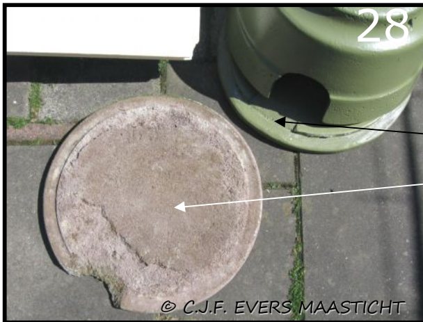
Afb.28 Het egelhuis heeft een grondige restauratie ondergaan. Als bij houtbeton de verf begint te bladeren is het noodzaak dit te verven. Dan kunnen houtbetonprodukten jaren meegaan.