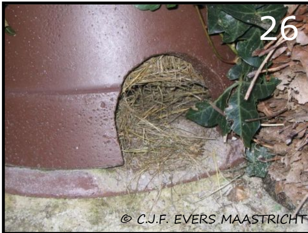
Afb.26 Aan het stro bij de ingang is goed te zien of het huis in gebruik is. Waarschijnlijk hebben bladeren toch de voorkeur om de winterslaap onder door te brengen.