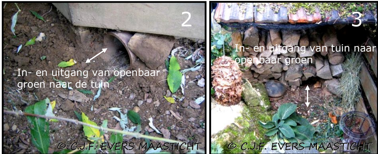
Afb.2 en 3 Bij de tuinaanleg is rekening gehouden met egels. Onder de "houtwal" is een ruimte gemaakt waar egels kunnen overwinteren. Ook een doorgang van de tuin naar het openbaar groen.

Als het verblijf klaar is hou je de eerste tijd alles goed in de gaten, maar als er niets te zien is of gebeurd, raakt het in de vergetelheid. Totdat je ineens vreemde uitwerpselen tussen de planten vindt. Dan wordt er weer extra opgelet.