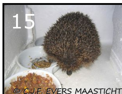
Afb.15 Egel in voederkist. Een kommetje is al opgegeten. Hij eet niet alles in een keer op, maar komt gedurende de nacht meerdere keren in de voederkist. Tot alles op is.