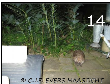
Afb.14 Op weg naar de voederkist. Wat staat er vandaag op het menu?

Toen zijn we naar andere oplossingen gaan zoeken en dachten die gevonden te hebben in de vorm van een voederkistje voor de egel, waar geen kat in kan komen.