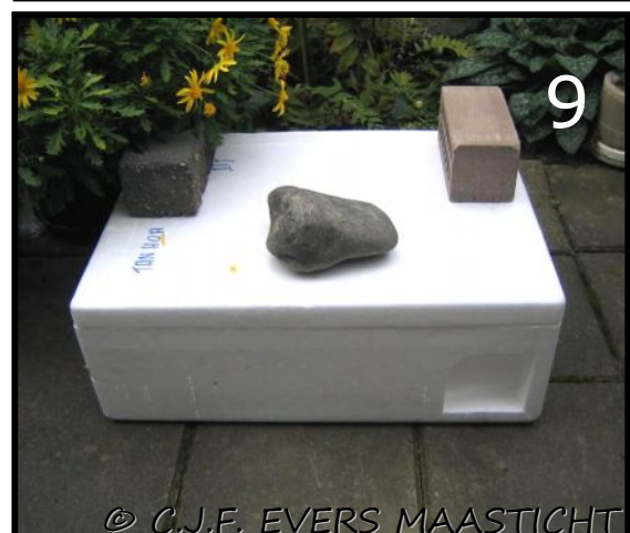
Afb.8 Met deksel en verzawaard met stenen. Afb.9 In-/uitgang aan een kant. In de doos kattenharen gevonden. Stelsel is nog niet goed.