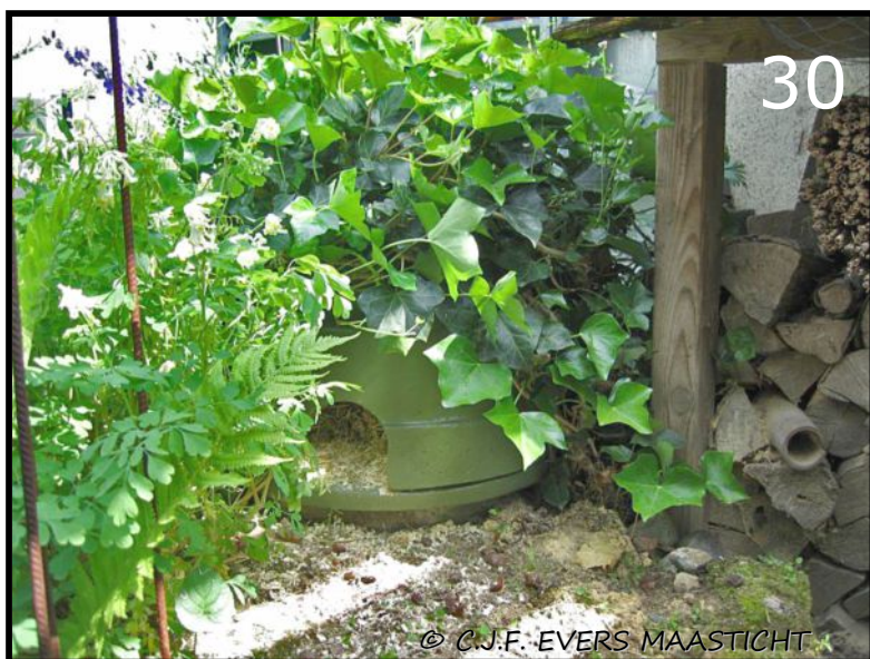
Afb.30 Het egelhuis staat, geres- taureerd en gevuld, weer op de oude plek. Laat de nieuwe bewoner maar komen.

Klik hier " piep" zei de muis in het egelhuis movie.