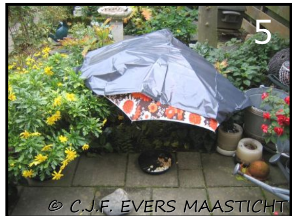
Afb.4 Bakje met egelvoer, fruit en hondenblikvoer. Het blikvoer is opgegeten en schoongelikt. (zoals katten dat doen maar dat was toen nog niet duidelijk). Afb.5 Tegen regen beschermen en steeds was het vleesvoer opgegeten.