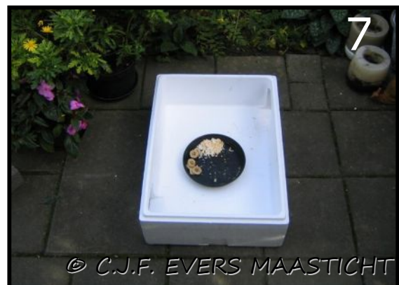
Afb.6 Opgegeten en schoongelikt door kat Afb.7 In doos met een in- en uitgang.