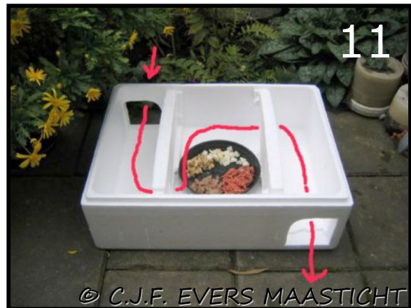
Afb.10 In de doos een gangetje gemaakt om dan via een bocht van negentig graden in de voedselruimte te komen. Afb.11 Tweede gangetje erbij gemaakt dat eventueel als "nooduitgang" kan fungeren. Nu zou een kat er toch niet meer bij kunnen komen?