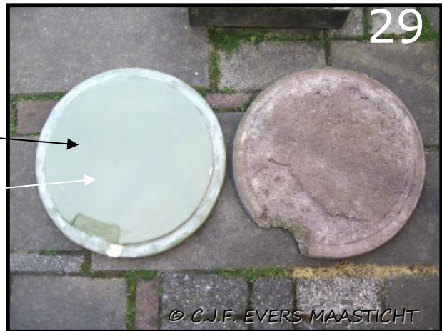
Afb.29 De bodemplaat is vervangen omdat deze vocht uit de grond aantrok. Van een dikke plaat piepschuim is een nieuwe bodemplaat gemaakt. Deze heeft goede isolerende eigenschappen in de winter.

Ondanks deze voorzorgsmaatregelen werd de vulling in de kast vochtig, d.w.z. bij het schoonmaken van de kast in mei bleek het stro gedeeltelijk beschimmeld. (Het plan voor dit jaar is het egelhuis in de herfst te vullen met bladeren, gemengd met varens. Dit om het ongedierte te weren. In vroeger tijden, toen men nog sliep op een strooien matras werd er varenblad onder vermengd om "bijtende" insecten (bedwantsen) te weren). Ook ga ik de bodemplaat vervangen door een zelf gemaakte bodemplaat van piepschuim. Dat isoleert goed en trekt ook geen vocht aan. Ook de afwatering van de koepel eens nader bekijken of daar verbeteringen mogelijk zijn. Op het net is ook ontzettend veel te vinden over egels. Als het je interesse heeft ga zelf ook eens Googlen.