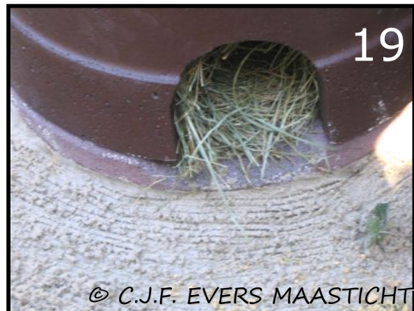
Afb.19 Om te controleren of het huis bewoond is is het zand voor de ingang geharkt.