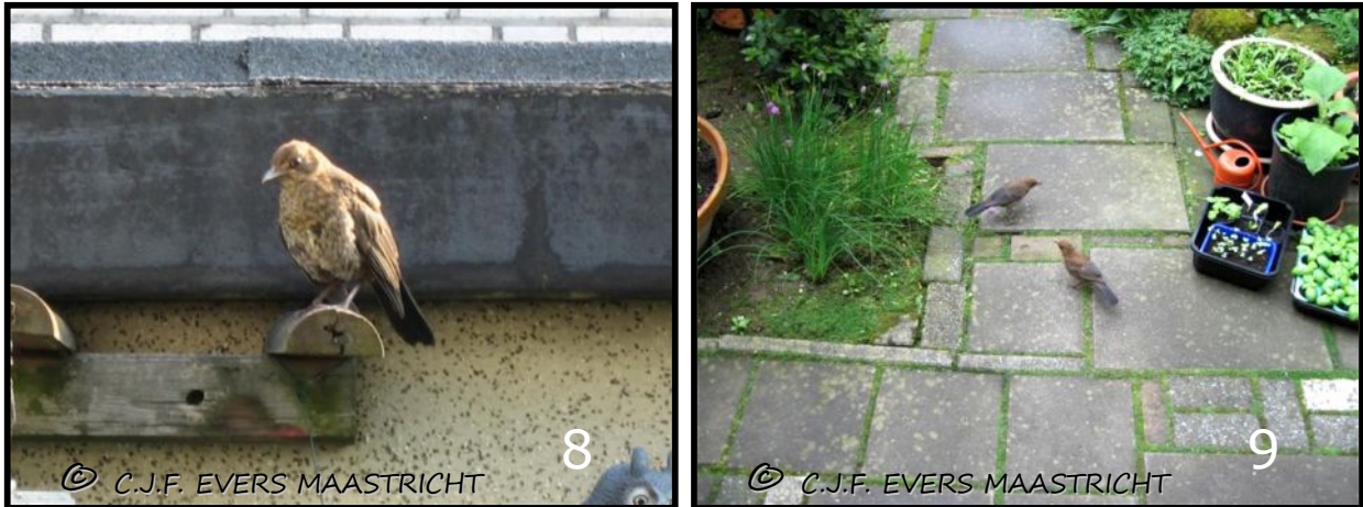
Afb.8 Een jonge, naïeve en onbevangen merel die de gevaren van de samenleving nog moet ontdekken. Dit is een kwetsbare periode, zeker als er katten in de buurt zijn. Afb.9 Twee jonge merels die al kunnen vliegen zitten te wachten op de meelwormen, die wij in droge perioden strooien.

jonge vogels opvoeden. Bij de meeste vogels helpen de mannen mee met het grootbrengen. Als de jonge vogels dan het nest verlaten loert het volgende gevaar om de hoek; o.a. katten. Mezen hebben daar geen last van omdat zij meteen goed kunnen vliegen. Het zijn vooral de jonge merels die daarmee geconfronteerd worden.