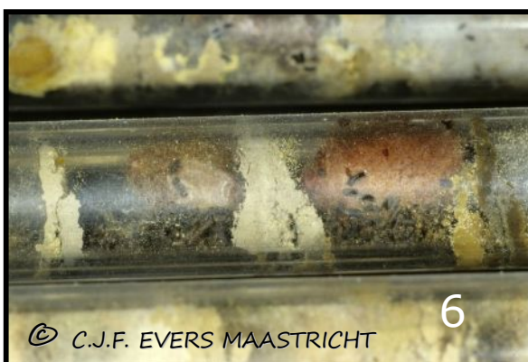
Afb.6 en 7 Nest-observatiebuisen van solitaire bijen. Links van de gehoorde metselbij, rechts van de tronkenbij. Aan de voedselvoorraad/poppen is te zien of het een mannelijke of vrouwelijke bij wordt. Bij deze twee soorten zijn de vrouwtjes groter dan de mannetjes. Daarom hebben de vrouwtjes meer voedsel nodig.

En dan bijvoorbeeld de angeldragers. Legt een vrouwtje/werkster een onbevucht ei dan wordt het een mannelijk individu. Legt een bevrucht vrouwtje (een werkster kan geen bevrucht ei leggen omdat zij niet bevrucht is) een ei, kan zij het sturen om een bevrucht of onbevucht ei te leggen. Legt zij een bevrucht ei dan wordt het een vrouwelijk individu.