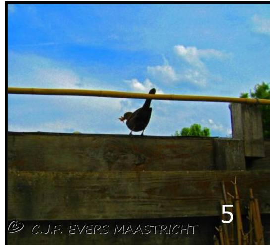
Afb.5 Verreweg de meeste soorten op deze aarde hebben een mannelijke of vrouwelijke partner nodig om zich te reproduceren.

En dan bijvoorbeeld de angeldragers. Legt een vrouwtje/werkster een onbevucht ei dan wordt het een mannelijk individu. Legt een bevrucht vrouwtje (een werkster kan geen bevrucht ei leggen omdat zij niet bevrucht is) een ei, kan zij het sturen om een bevrucht of onbevucht ei te leggen. Legt zij een bevrucht ei dan wordt het een vrouwelijk individu.