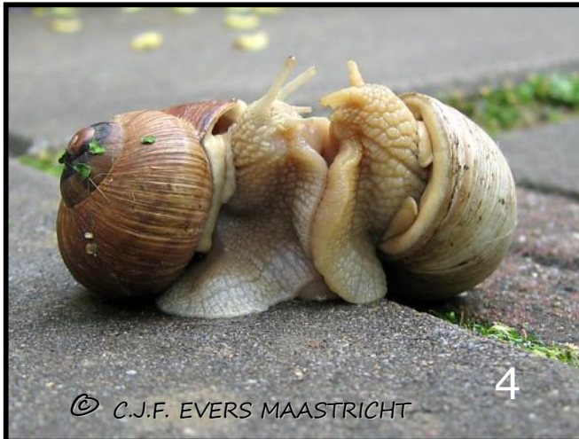
Afb.4 Wijngaardslakken hebben geen partner nodig om zich voort te planten. Zij zijn zowel man als vrouw. Toch zie je ze regelmatig sensueel vrijend met een soortgenoot.

De natuur/evolutie heeft echter ook soorten voortgebracht die geen partner nodig hebben en zich zonder paring kunnen reproduceren. Zij worden ook wel hermafrodieten (zowel man als vrouw) genoemd. Een voorbeeld hiervan is de wijngaardslak. Toch kun je ze regelmatig met een partner zien vrijen, maar echt nodig is dat niet om nakomelingen te krijgen.